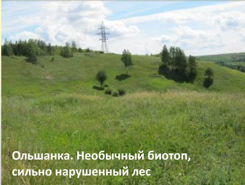
Ольшанка. Необычный биотоп, сильно нарушенный лес