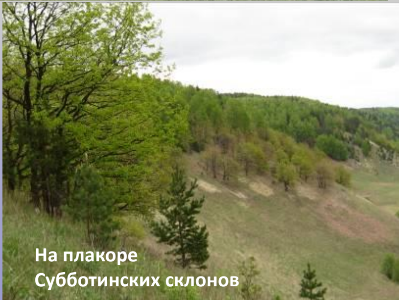
На плакоре Субботинских склонов