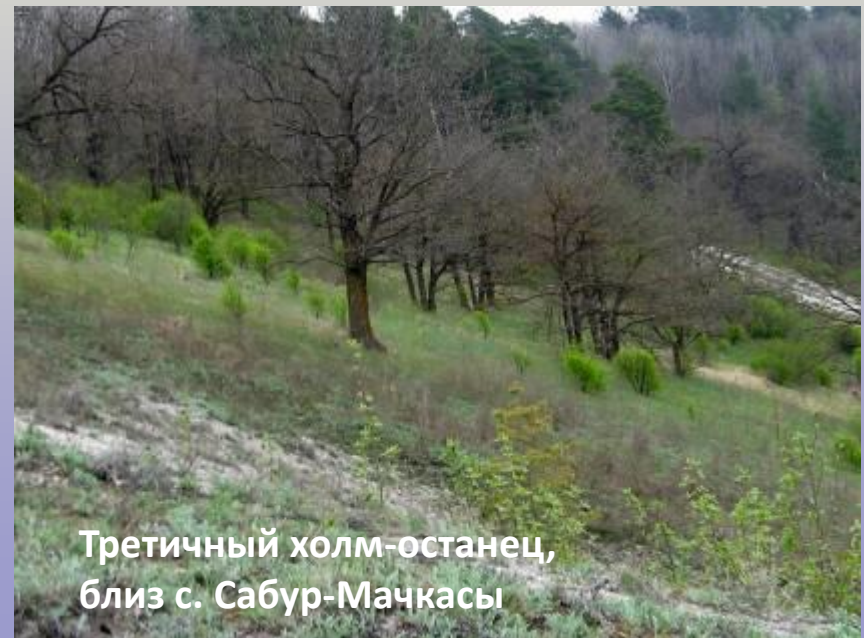
Третичный холм-останец, близ с. Сабур-Мачкасы