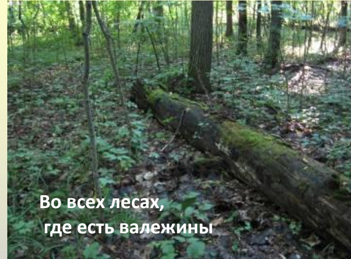
Во всех лесах, где есть валежины